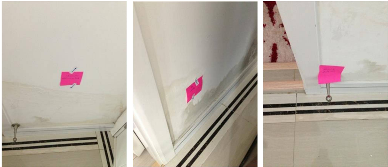
4. เช็คน้ำซึม+เก็บงานสีผนัง + กันชนประตูเปลี่ยนใหม่ (เก่า)