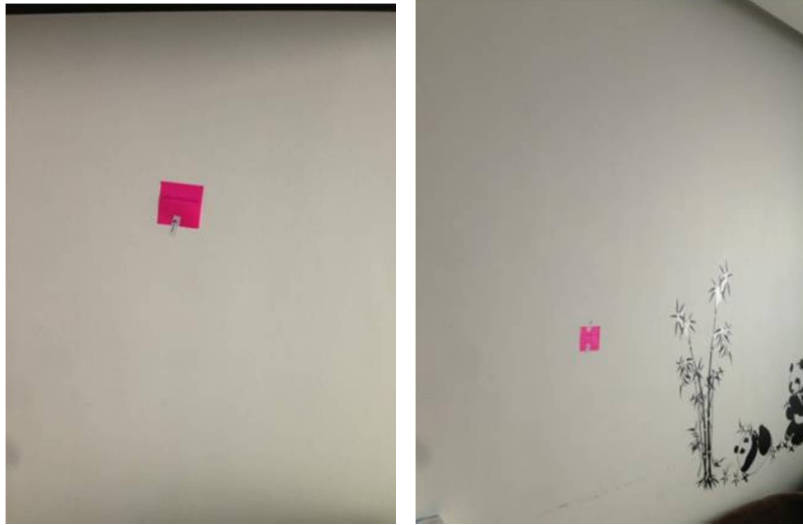
3. งานสีภายในห้องโถง ทาสีใหม่ทั้งหมด