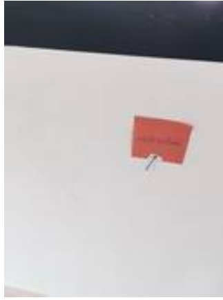
4. ผนังมีรอยดินสอ (ทำความสะอาด)