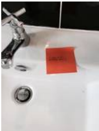
3. อ่างล้างหน้ารั่วซึม