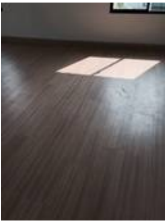
7. ทำความสะอาดพื้นลามิเนต