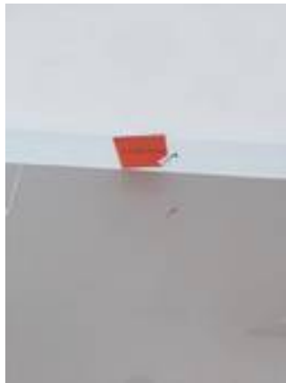
2. เก็บงานสีบัวโดยรอบ และทำความสะอาด