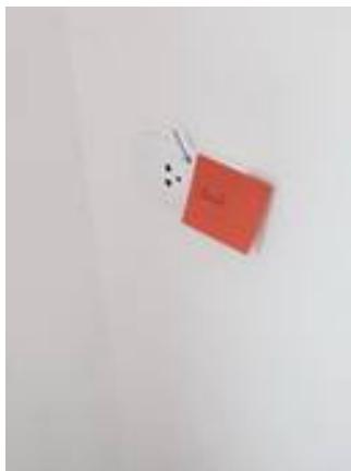
3. ปลั๊กเดอะตี