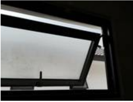
7. เก็บงานขอบเฟรมบานกระทุ้ง (เลอะสี)