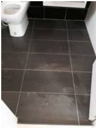
2. ทำความสะอาดพื้นกระเบื้อง