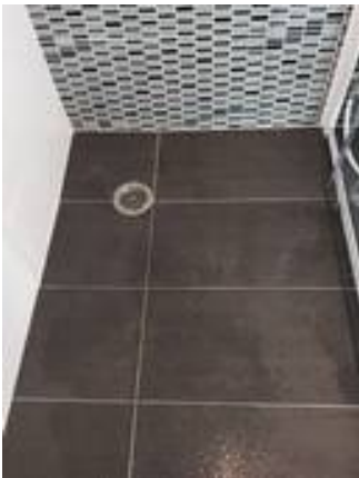
6. ขาแนวพื้นห้องอาบน้ำใหม่