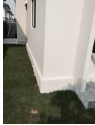
8. สีภายนอกต่าง (ทาใหม่) เก็บงานสีดินผนัง