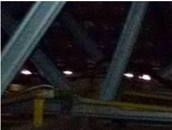
ปิดกล่องสายไฟใต้หลังคาให้เรียบร้อย