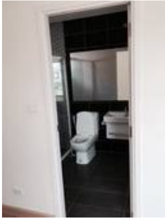
1. นี้อุตบานพับประตูชั้นไม้สนิท