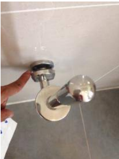
5. ที่ใส่กระดาษทิชชูเป็นคราบ + ติดตั้งอุปกรณ์ไม่เรียบร้อย