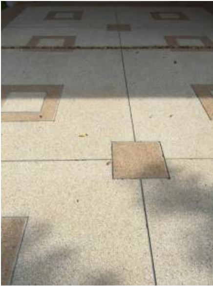
5. ทำความสะอาดโรงรถ