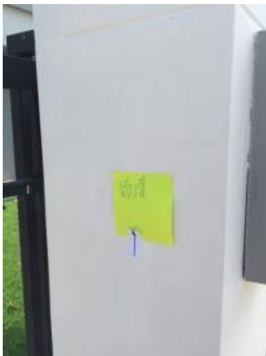
3. ผนังมีรอยแตกร้าว เก็บงานดี