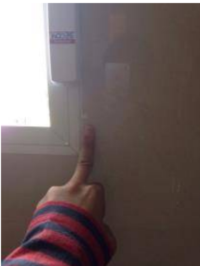
4. กระเบื้องตรงบานกระทุ้งบิน เปลี่ยนใหม่