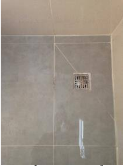
2. ยานแนวพื้นใหม่ตรงห้องอาบน้ำ