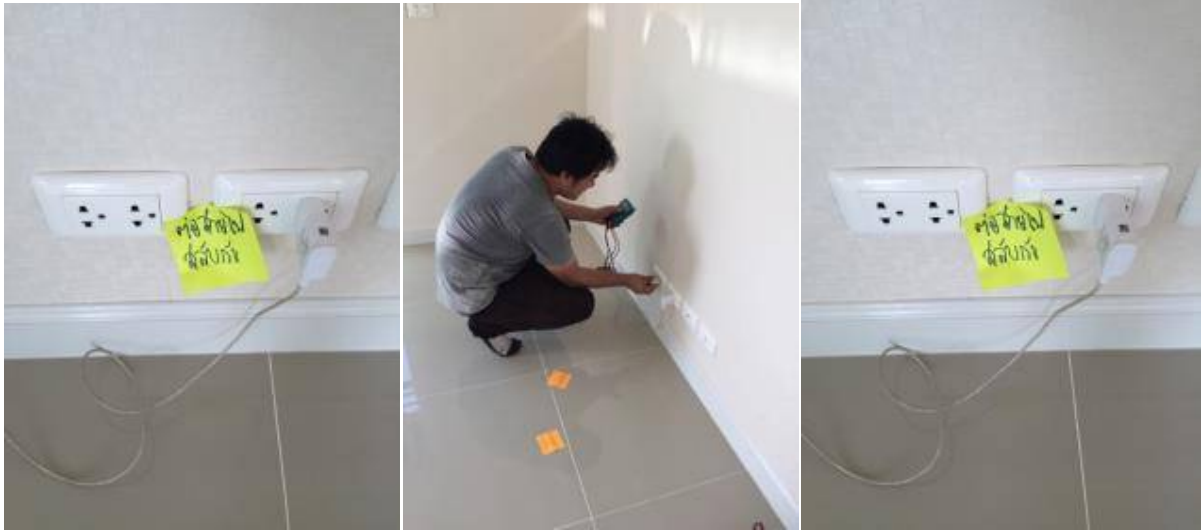
5.ต่อสายไฟสลับกัน