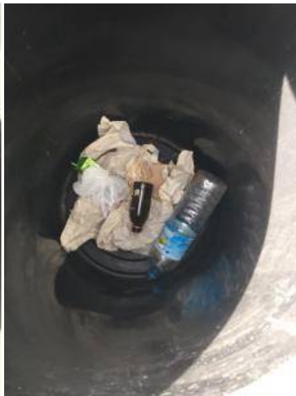
7.ทำความสะอาดถังขยะ