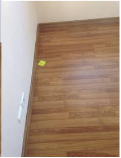
2. เช็ดพื้นยวบทั้งหมดรอบห้อง