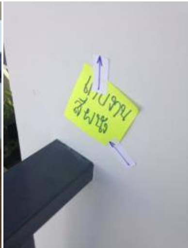
เก็บงานสีผนัง + เก็บงานรอยแตกร้าว