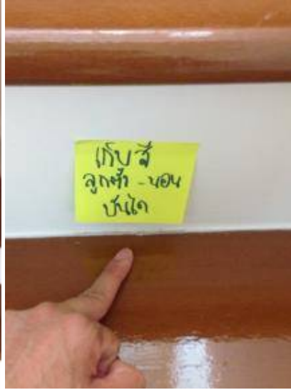
4. เก็บสีลูกตั้งลูกนอนบันไดทุกชั้น