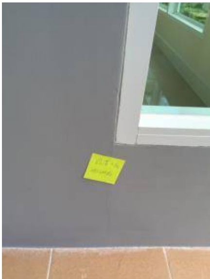
2.เก็บสี+เก็บรอยแตกร้าว