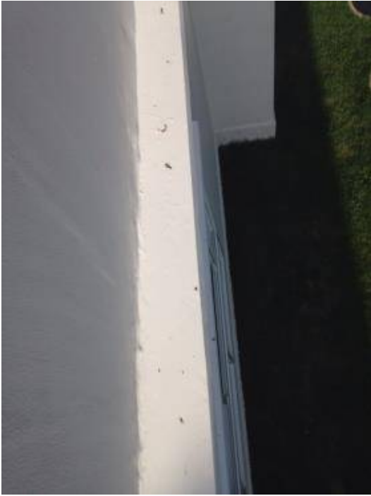
4. เก็บงานสีผนังด้านนอก