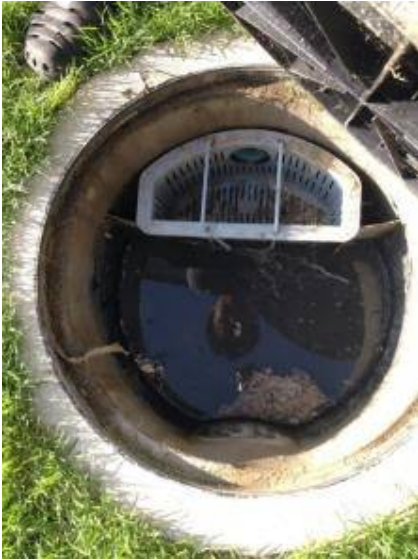
5. ทำความสะอาดบ่อดักไขมัน