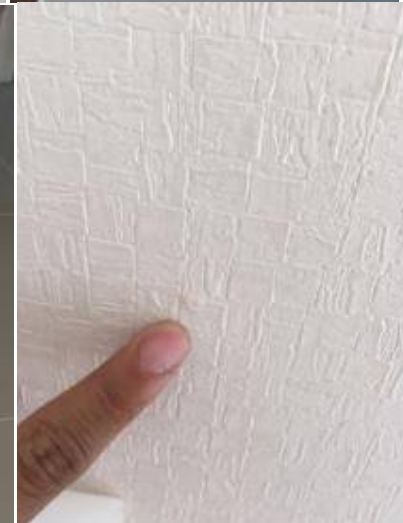
3. เช็ควอลล์เปเปอร์ขาด + วอลล์เปเปอร์เป็นอนทำความสะอาด ซ่อมแซมวอลล์เปเปอร์ใหม่