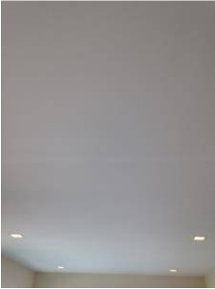
4. เก็บงานรอยต่อฝ้าเพดาน + เก็บงานสีฝ้า