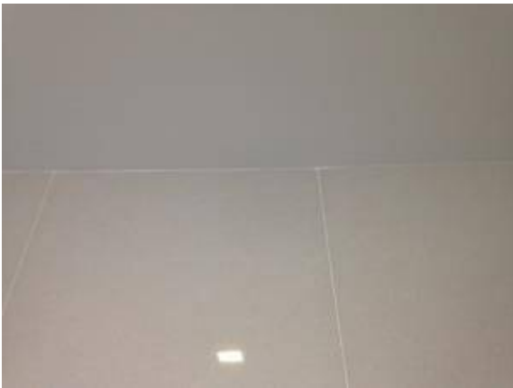
2. ยานแนวผนังตรงผ้าใหม่