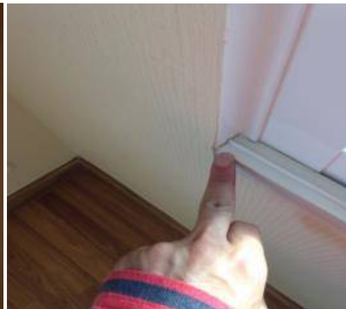
5. ทำความสะอาดหน้าต่าง + ตามร่องเฟรม