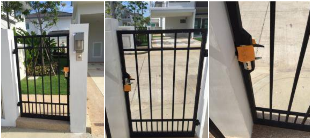
2. เปลี่ยนมือจับประตูเหล็ก