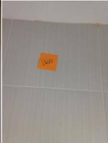
1. ยาน้ำมันใหม่+กระเบื้องโพรง