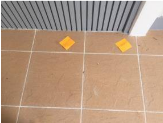
1.กระเบื้องทางเข้าห้องโถงโพรง 2 แผ่น