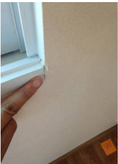
4. วอลล์เปเปอร์ขาด