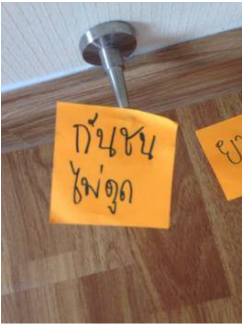
2.กั้นชนประตูไม่ดูต