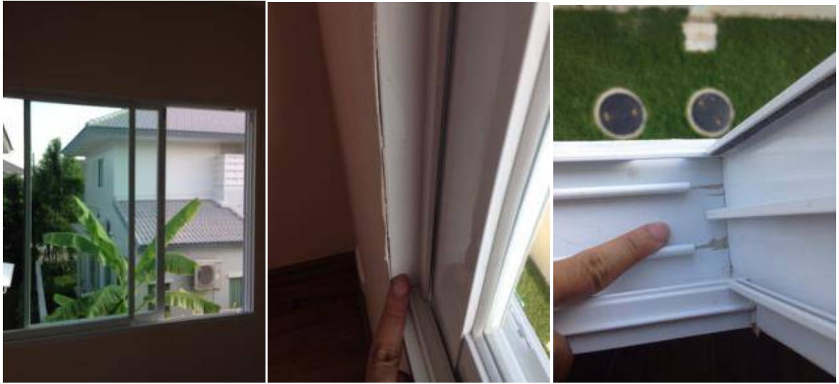
5. เก็บสีเฟรมหน้าต่าง + ทำความสะอาด