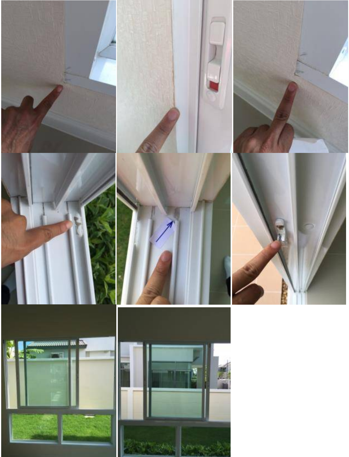
4. เก็บงานสีเฟรมประตูหน้าต่าง+ ทำความสะอาด