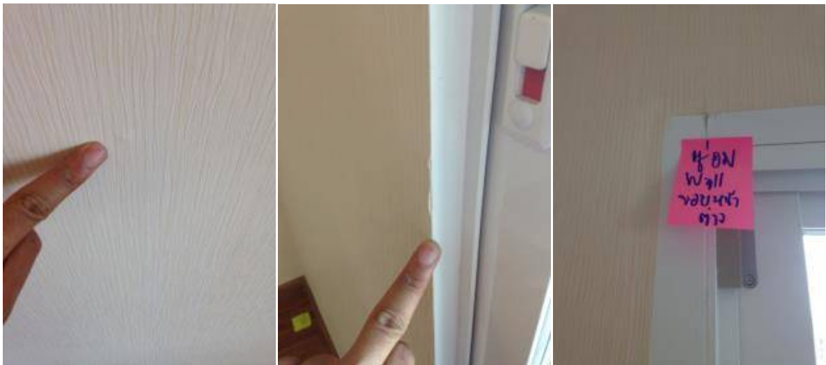
2. วอลล์เปเปอร์เบ็อน มีเม็ดทรายอยู่ด้านใน วอลล์เปเปอร์เปิด เปลี่ยนซ่อมแซมวอลเปเปอร์ใหม่