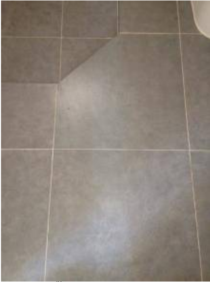
3. ยานแนวพื้นใหม่