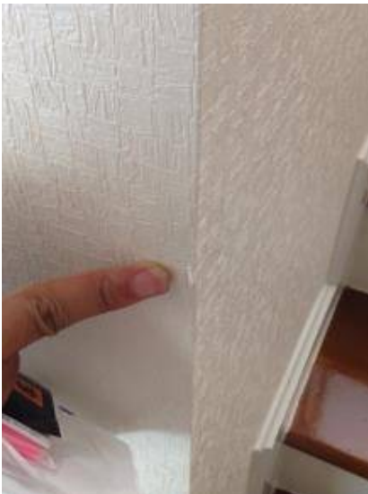
5. วอลล์เปเปอร์ทางขึ้นบันไดขาด