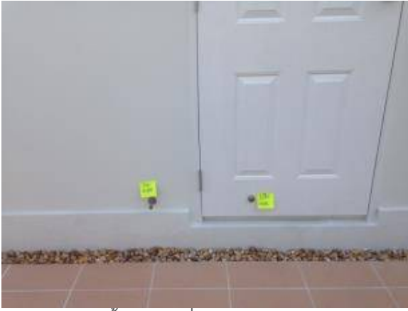
2. กั้นชนประตูขึ้นส้วมเปลี่ยนใหม่