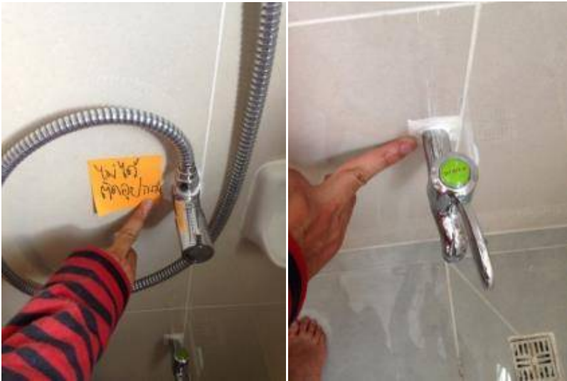
3. ไม่ได้ติดตั้งอุปกรณ์ฝาดรอบก๊อก ฝักบัว