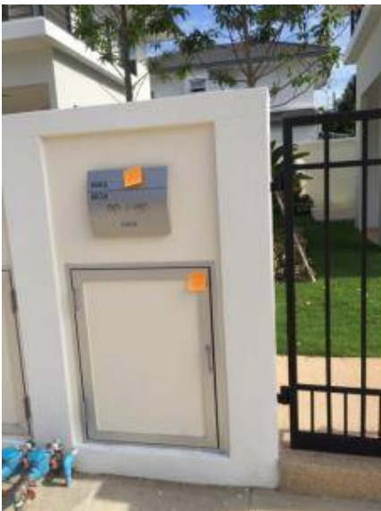
6. ทำสะอาดเมล็่บ็อกซ์เป็นคราว