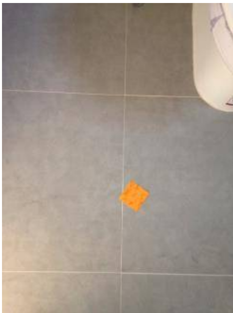
1. กระเบื้องโพรง