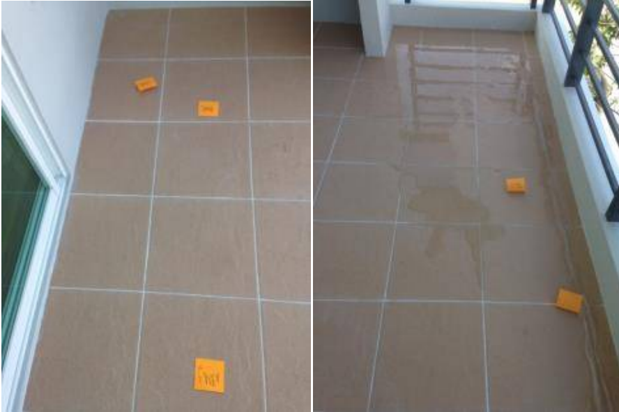
1. กระเบื้องโพรง