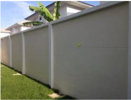
3. กำแพงมีสีพองเก็บงานสีใหม่