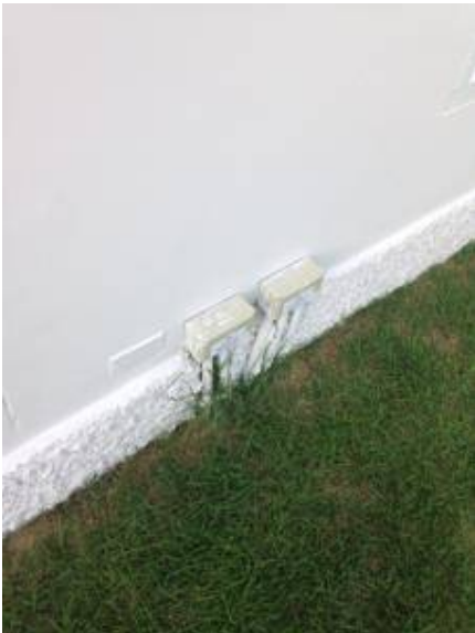
4. ฉีดยากันปลวก