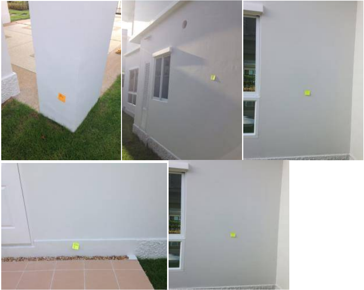
1. เก็บงานสีต่างตรงดินเสา เก็บงานสีต่างรอบบ้านทั้งหมด