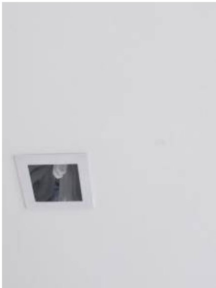
6.เก็บผ้าเป็นรอย