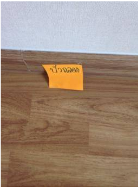
3. เช็ดบัวรดน้ำ