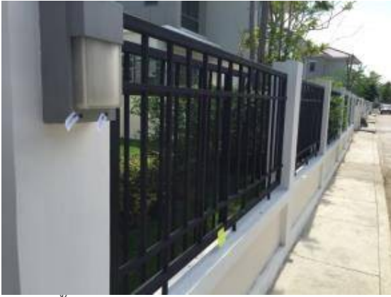
4. เก็บสีรั้วใหม่ทาสีกันสนิม