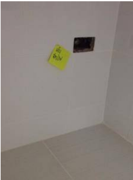
3. เก็บสายไฟใต้ซิงค์