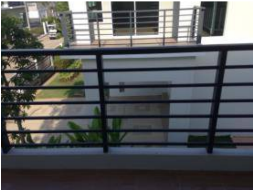
2. ทำความสะอาดราวกันตก