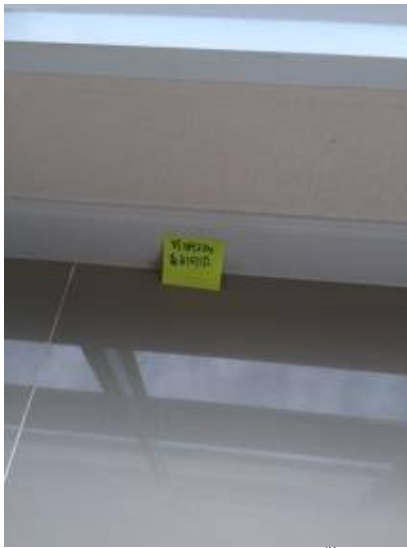
2. ทำความสะอาดบัวโดยรอบทั้งหมด