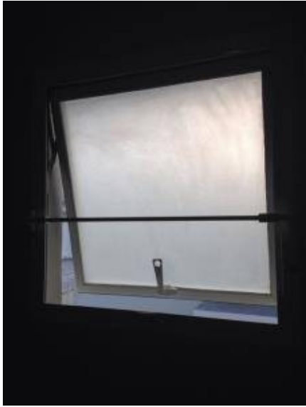
4. เก็บยาแนวตรงขอบบานกระทุ้ง