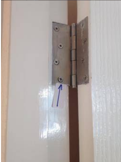
1. น็อตประตูปานพับขึ้นไม่สนิท