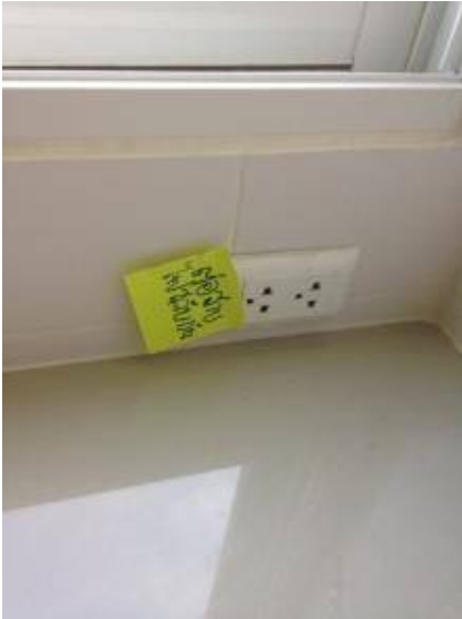
2. ต่อสายไฟสลับกัน