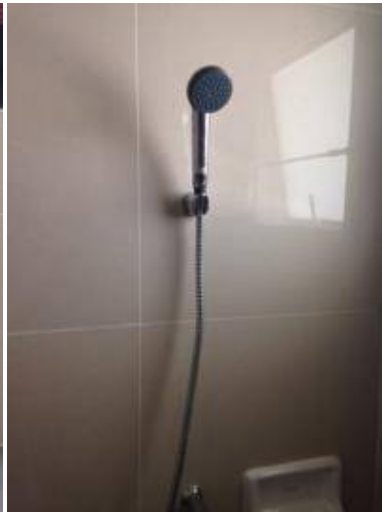
4. ก๊อกน้ำเป็นคราบ + ฝักบัวเป็นคราบ