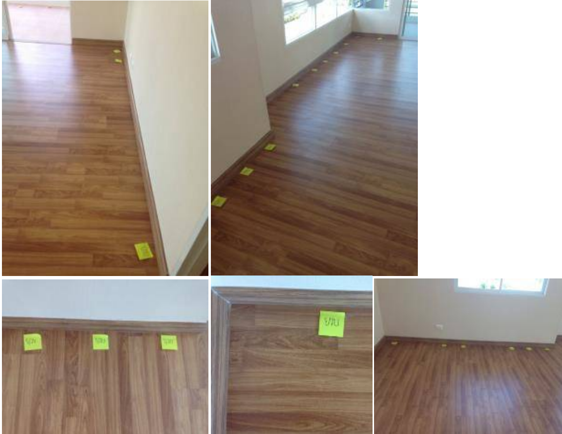
1. เช็คพื้นยวรอบห้อง