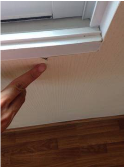
3.วอลล์เปเปอร์เปิด