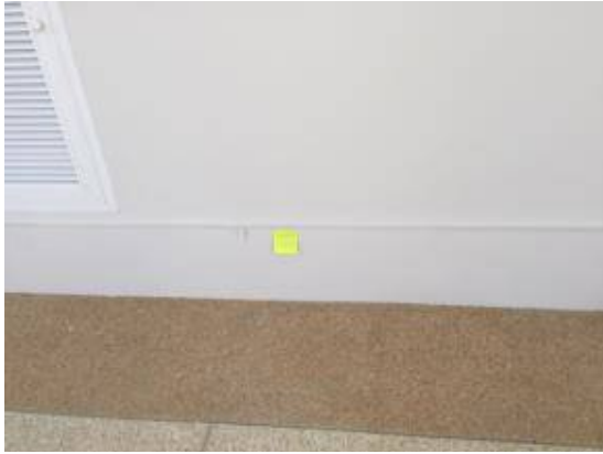
10.ทำความสะอาดผนัง + ทาสีใหม่