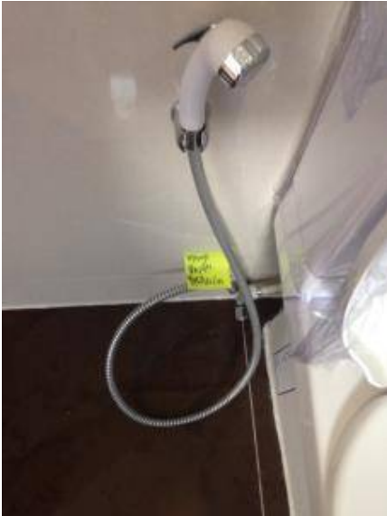
1. ติดตั้งสายฉีดให้เรียบร้อย(รั้ว)