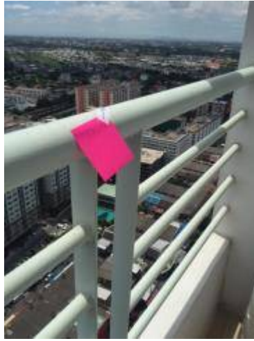
9. เก็บสีราวกันตก