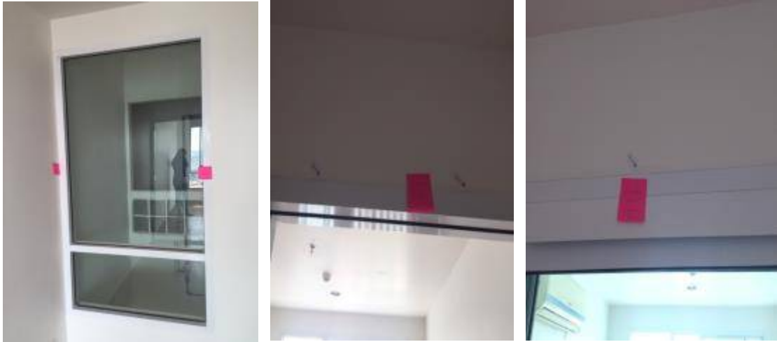
6. เก็บงานสีตามขอบเฟรมประตูหน้าต่างทั้งหมด