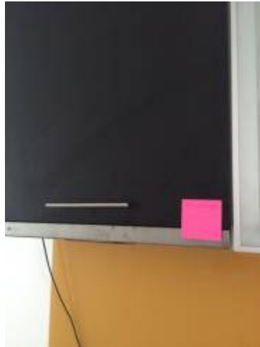
2. ทำความสะอาดตู้ + เก็บสื่ตู้ชุดครัว