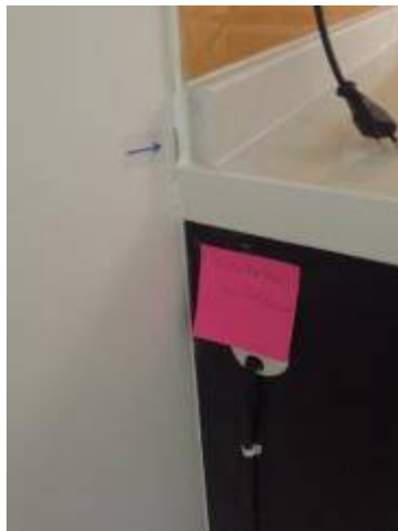
9. เก็บงานซิลิโคนรอบซิงค์ทั้งหมด