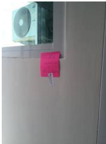
7. เก็บงานสีหลอดตามเฟรมกระจก+ซิลิโคนไม่เรียบร้อย