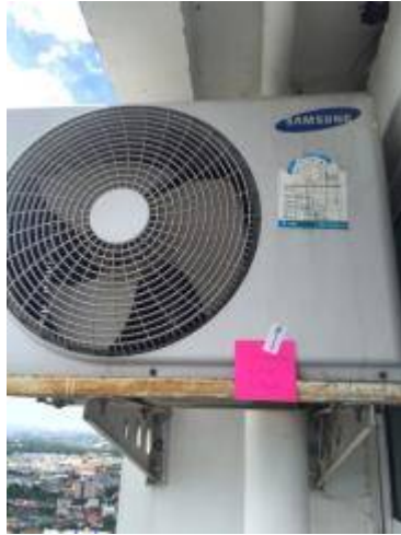
5. ที่ตั้งแอร์ขึ้นสนิม