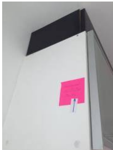
3. ติดตั้งชุดแขวนด้านบนใหม่ให้เรียบร้อย