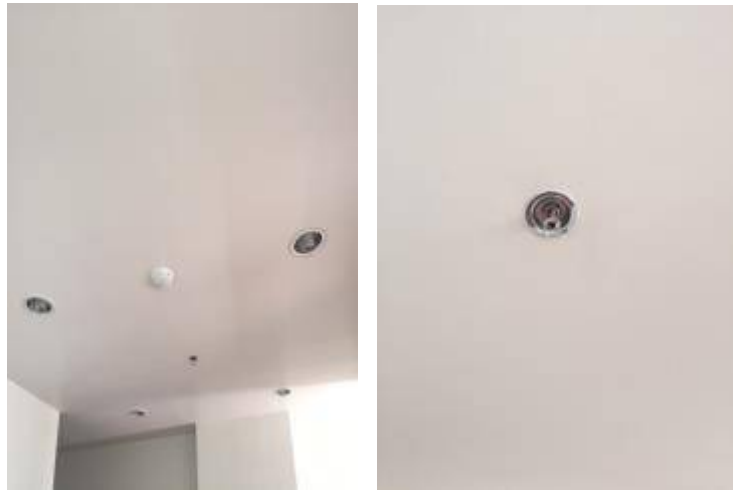
6. สีหลอดดาวไลน์เก็บซิลิโคนรอบดาวไลน์+สปริงค์เกอร์ เช็ดทั้งหมด