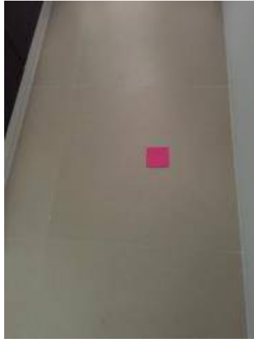
7. ยานแนวพื้นใหม่+ทำความสะอาดพื้น