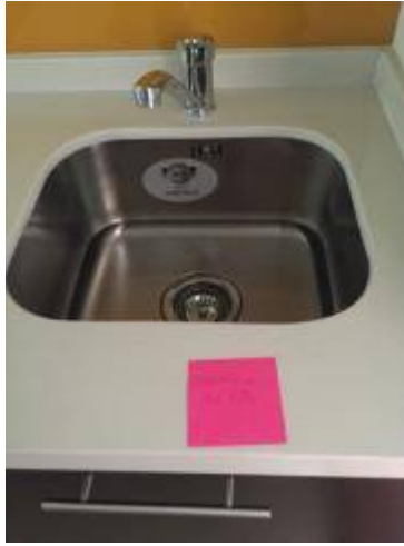
1. อ่างล้างจานมีน้ำรั่วซึม