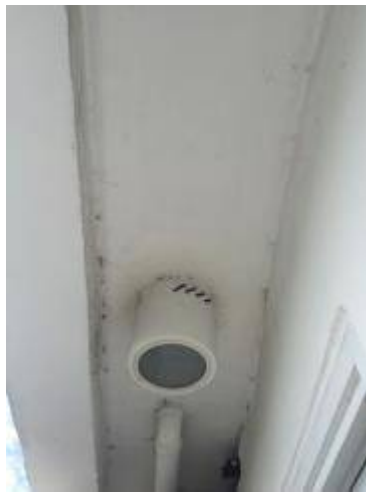
10. เก็บงานสีเพดาน