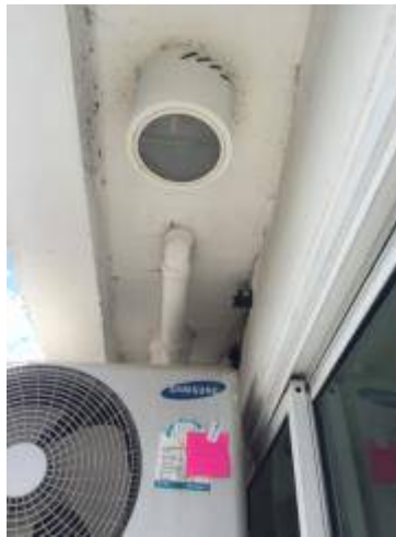
7. เก็บงานผนังปูนตรงท่อส่งแอร์ให้เรียบร้อย