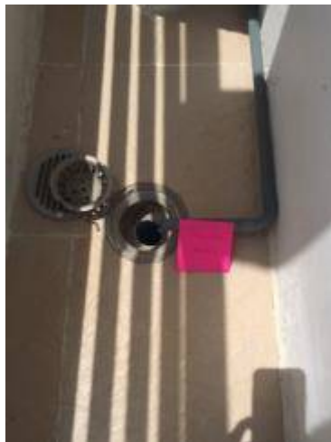
8. ทำความสะอาดฟอร์เต็ม