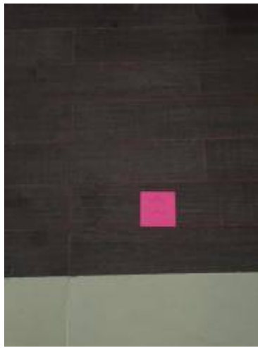
8. ขัดพื้นใหม่+เคลือบสี