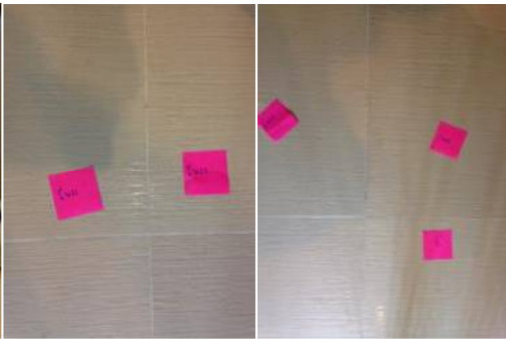
1 กระเบื้องโพรง+ยาแนวพื้น